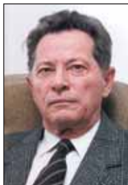
Piše: prof. dr. Jozo Sović

Imovinu uređuje imovinsko pravo i označava skup prava i obaveza koji pripadaju određenom vlasniku. Stoga za objekt uvijek ima neki predmet, ljudsku radnju, osobno dobro ili proizvod ljudskog duha, čija se vrijednost može izraziti u novcu i koji se pravno može prenositi sa jednog vlasnika na treća lica