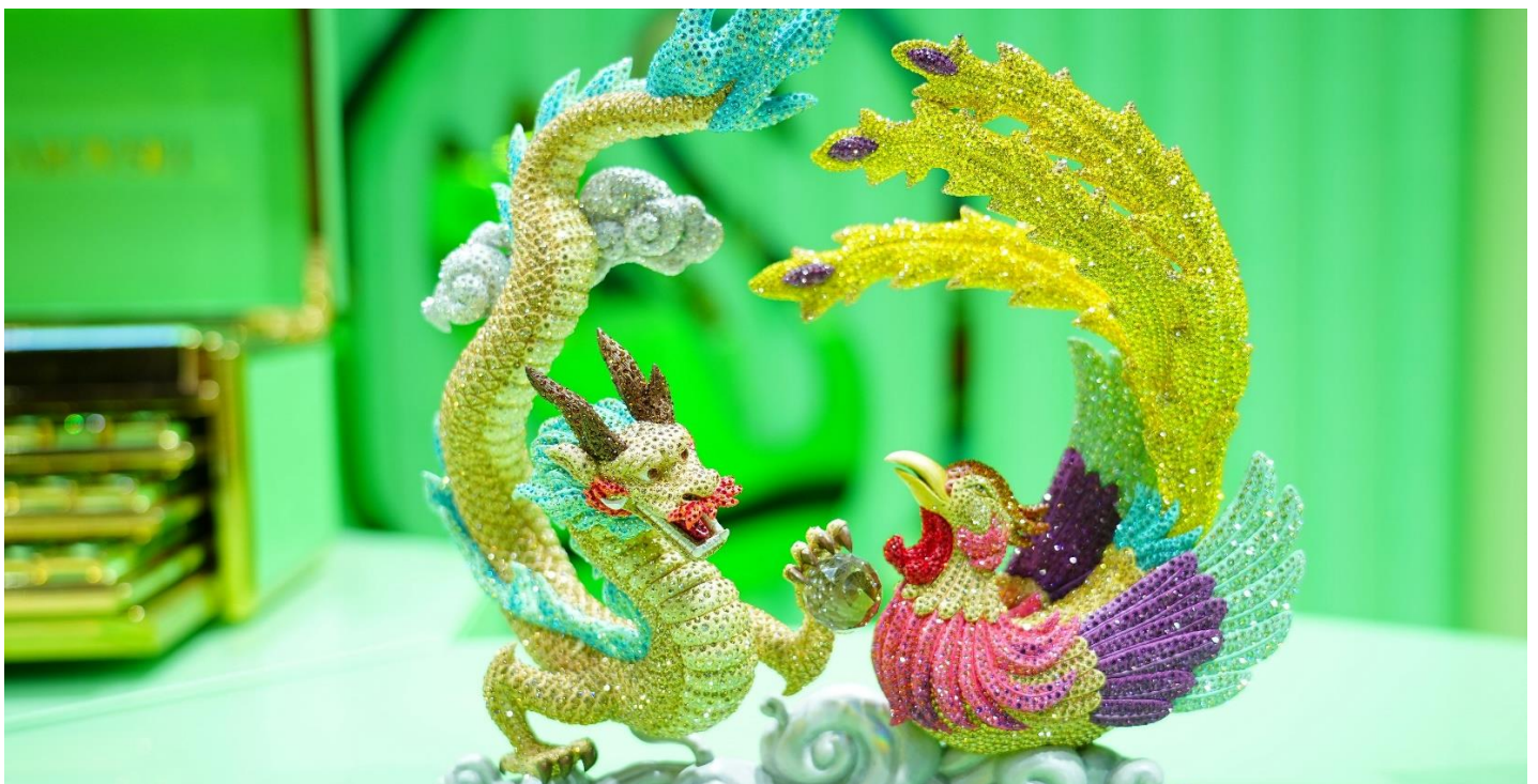
Slika 6: Swarovski obilježava proslavu Kineske godine zmaja na 6. CIIE, 2023

Šesti CIIE, održan u Šangaju od 5. do 10. novembra 2023. godine, završio je sa rekordnim iznosom privremenih dogovora od 78,41 milijardu dolara, što predstavlja porast u odnosu na 57,83 milijardi dolara na prvom izdanju. Expo je predstavio preko 400 novih proizvoda i tehnologija , ističući inovacije poput monitora moždanih talasa i vozila na vodonične ćelije. Naglasak je bio na zelenom razvoju smanjenjem emisija ugljen-dioksida, te je privukao raznovrsno globalno učešće, uključujući 154 zemlje i regiona. Kulturni elementi su integrirani, podstičući međusobno učenje i jačajući ulogu Kine u globalnoj trgovini i inovacijama.