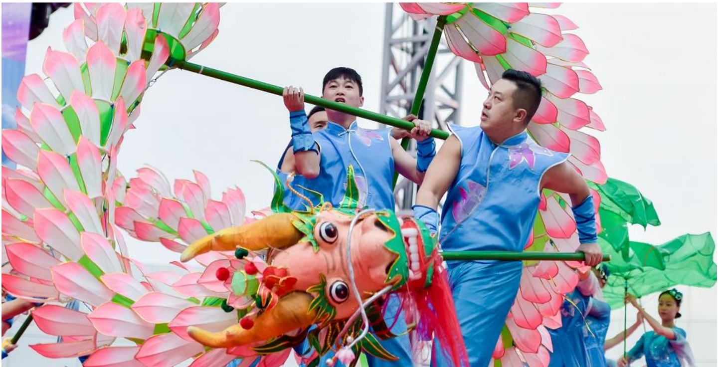
Slika 4: Kulturalna privreda na otvaranju CIIE

Četvrti CIIE, održan 2021. godine, uspješno je održan uz prisustvo kineskog predsjednika Xi Jinpinga putem video veze 4. novembra. Sajam je obuhvatio ukupnu površinu od 366.000 kvadratnih metara za poslovne izložbe, s 2900+ izlagača iz 58 zemalja i 39 domaćih trgovinskih misija . Više od 80% kompanija iz Global 500 i vodećih industrija ponovno je potvrdilo svoje učešće , dok su sporazumi vrijedni 70,72 milijardi dolara postignuti za jednogodišnje kupovine roba i usluga. Organizacija CIIE-a u online formatu omogućila je učešće 58 zemalja i 3 međunarodne organizacije u zemljama izložbenim eksponatima, što je unaprijedilo globalnu razmjenu i saradnju u vrijeme pande mije.