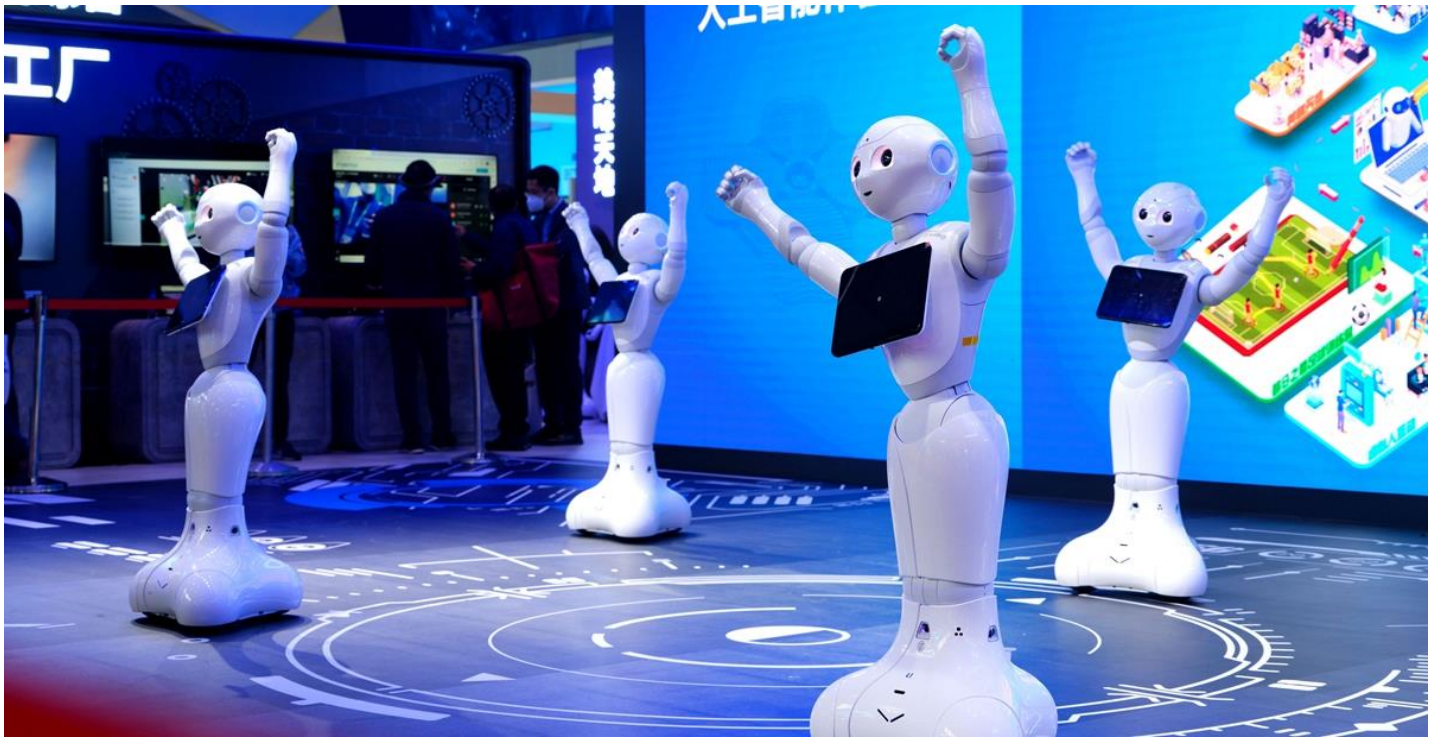
Slika 5: Roboti izvode plesnu tačku na petom CIIE, 2022