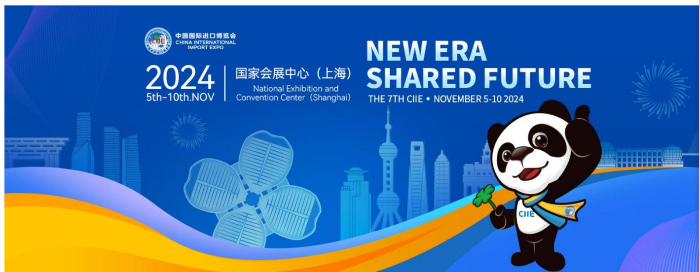
Slika 1: Najava za 7. CIIE

Ove godine, od 5. – 10. novembra 2024. , se u Šangaju održava sedmi Kineski Međunarodni uvozni sajam/China International Import Expo (CIIE). Prvi CIIE održan je 2018. godine i od tad se održava u novembru svake godine.